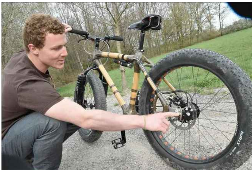
Les vélos vosgiens In'Bô présents au salon Made in France.