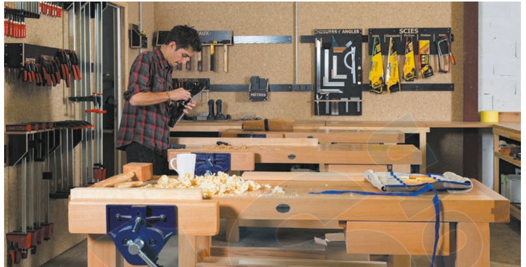
Le Xylolab : un fablab bois.

Le dispositif s'adresse à des diplômés de bac +2 à bac +5, issus d'écoles d'ingénieurs, d'architectes, d'écoles de design, d'universités et écoles françaises et de l'étranger ou d'un BTS, qui ont un projet en lien avec le bois – construction, design, création de meubles, objets, parquets,